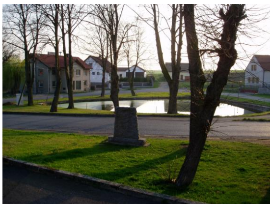
Vzrostlá zeleň s požární nádrží v místní části Druhlice

Obec Daleké Dušníky se nachází v severovýchodní části okresu Příbram. Rozkládá se na jihovýchod od údolí potoka Kocáby, pod kopci Druhlický vrch (442 m n. m.) a Tuškovský vrch (441 m n. m.). Obec je vzdálená 7 km od Dobříše a 14 km od Příbrami a 48 km jižně od Prahy. Má dvě místní části, vlastní Daleké Dušníky, kde sídlí obecní úřad a Druhlice. Rozloha obce je 681 hektarů.