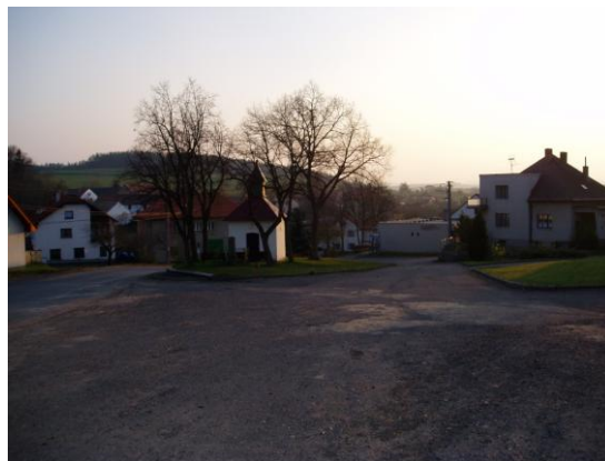
Kaplička v Dalekých Dušníkách se vzrostlými lipami

Obec Daleké Dušníky se nachází ve Středočeském kraji v blízkosti města Dobříše, ke kterému administrativně spadá. Nejbližšími malými sídly jsou Svaté Pole (3 km) a Višňová (5 km). Obec leží na jih od hlavního města Prahy na důležité spojnici (rychlostní komunikace R4 směr Písek a Strakonice). Blízkost větších měst s dostatečnou občanskou vybaveností vytváří z Dalekých Dušníků vyjížďkovou obec. Města Dobříš a Příbram a relativně dostupná vzdálenost Prahy zajišťují pro obec veškeré služby nadmístního významu.